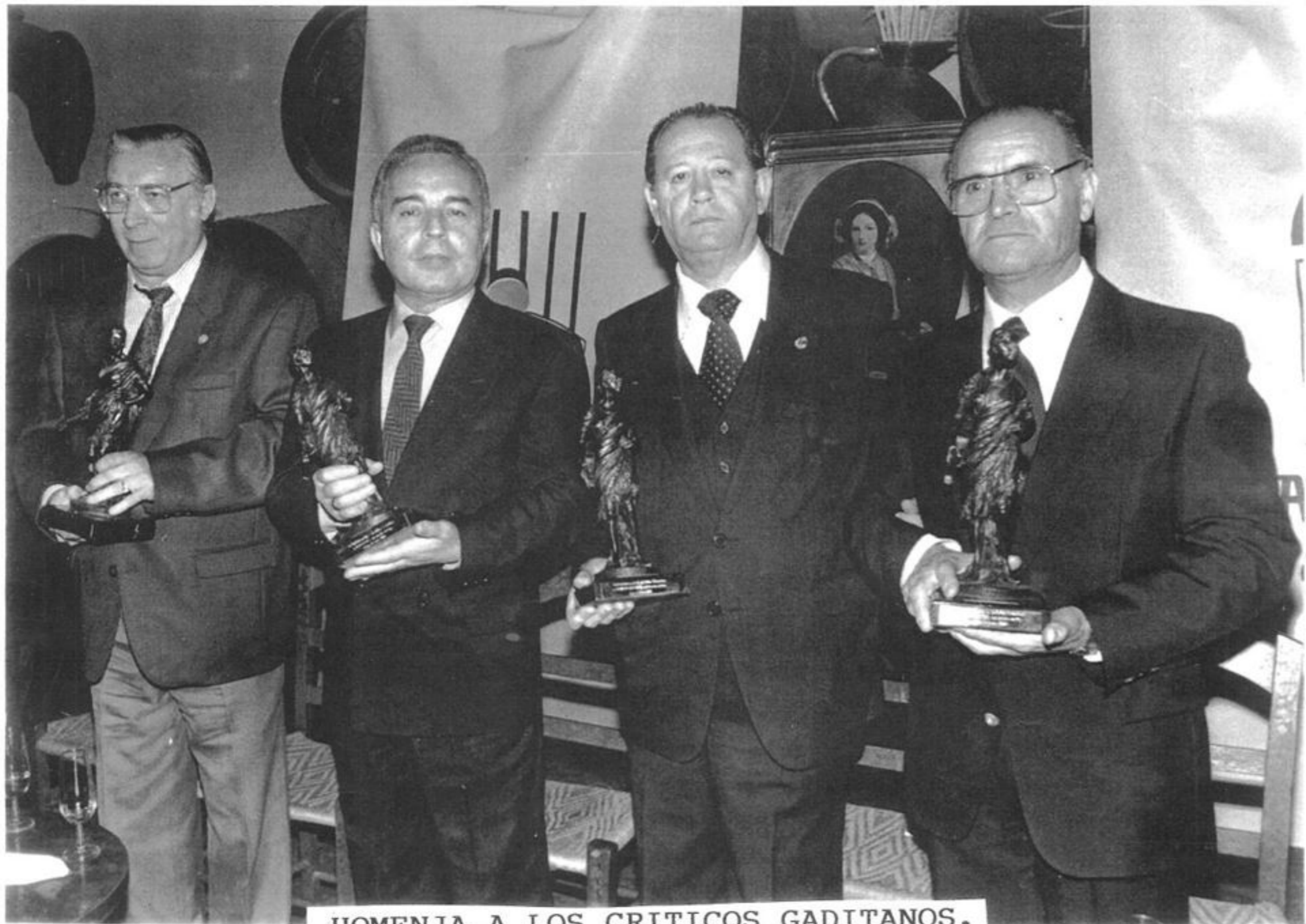
HOMENJA A LOS CRITICOS GADITANOS.